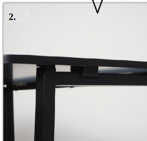
Abbildung: Unterseite Tischplatte