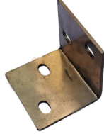
L shape connector × 8PCS