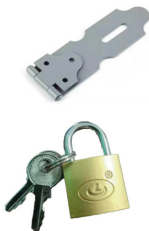
Lock × 1PCS